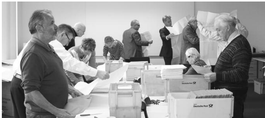
Es war einiges zu tun beim Öffnen der Wahlbriefe

Die Vertreterversammlung ist das von den Mitgliedern gewählte Beschlussorgan der Kammer. Sie besteht aus 125 Mitgliedern, wobei mindestens 75 von ihnen Pflichtmitglieder sind. Die 6.536 stimmberechtigten Mitglieder der Bayerischen Ingenieurekammer-Bau waren vom 20. September bis einschließlich 11. Oktober 2016 aufgerufen, über die Besetzung der VII. Vertreterversammlung abzustimmen. Es wurden 2.788 gültige Stimmzettel abgegeben. Die Auszählung fand am 12. und 13. Oktober statt.