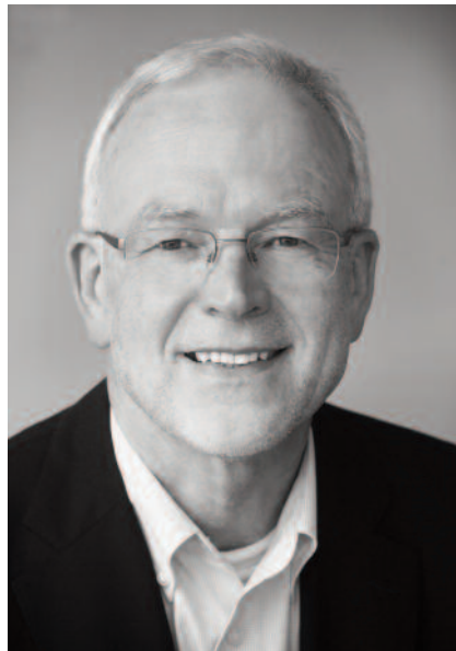
Prof. Dr.-Ing.habil. Norbert Gebbeken.

Die umfassende Digitalisierung aller für die Planung und für das Bauen relevanter Prozesse und die Vernetzung aller Daten in virtuellen Bauwerksdatenmodellen bergen ein erhebliches Optimierungspotential am Bau. Dies wurde erst möglich, durch das schnelle Internet, durch die Vernetzung der „Dinge“, wie heute gesagt wird. Im Rahmen der digitalen Planung werden