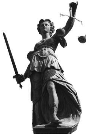
Streit um Leistungen nach HOAI

In einem jetzt veröffentlichten Fall hatte das OLG Köln (Urteil v. 27.01.2014, 11 U 100/13) eine Variante zu entscheiden, in der ein Bauunternehmen nur mit verschiedenen Planungsleistungen der HOAI für den Neubau einer Unternehmenszentrale mit Tiefgarage beauftragt wurde. Der Auftrag umfasste keine Bauleistungen, jedoch war vereinbart, dass die Planung nach den Regelungen der HOAI berechnet werden sollte, falls der Gesamtauftrag über die Erstellung des Gebäudes nicht auch erteilt werden sollte. Umgekehrt – wenn also auch die Bauausführung beauftragt werden würde – sollten die im Planungsauftrag ausgewiesenen Pauschalpreise jeweils in der entsprechenden Bauauftragssumme enthalten sein. Zu dieser Baubeauftragung kam es dann jedoch nicht mehr, was wesentlich daran lag, dass die als Ergebnis der Planung prognostizierten Kosten für den Bauherrn zu hoch waren. Das Bauunternehmen legte sodann