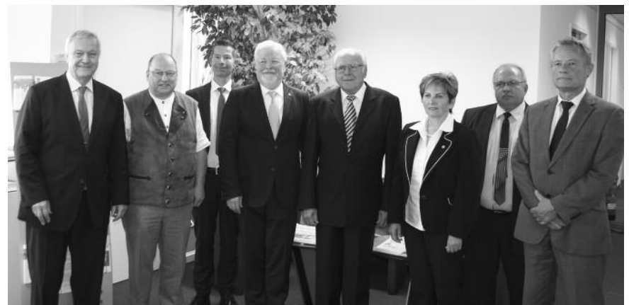
Ungarische Delegation zu Gast in München.

Die ungarischen Gäste interessierten sich besonders für das bayerische Fortbildungssystem. Die ungarische Kammer schreibt in ihrer Satzung eine Fortbildung in rechtlichen wie fachlichen Themen vor. Die Zusammenstellung der Themen, die Auswahl der Re-