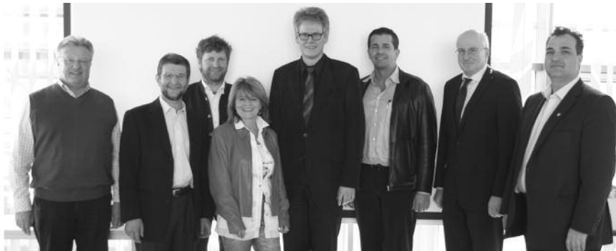
Wie wirkt sich BIM auf das Baurecht aus?