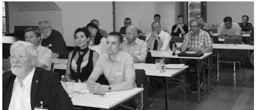
Neues Thema für die Regionalforen: Bautechnische Nachweise.