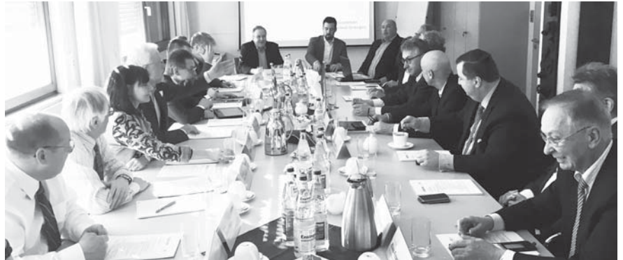
Vorstände der Baylka-Bau und der INGBW bei gemeinsamer Sitzung.

Als starke Kammer setzt sich die Baylka-Bau für die Belange aller am Bau tätigen Ingenieure ein. Um die Arbeit für den Fachbereich der Ingenieurgeo-