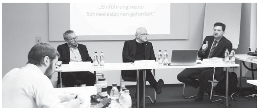
Gemeinsame Forderung der Einführung neuer Schneelastzonen.

Bei 53 Prozent der Gemeinden sind teilweise wesentlich geringere Schneelasten anzusetzen, was im Umkehrschluss wieder ein wirtschaftlicheres Bauen ermöglicht. In 17 Prozent der